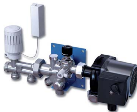
LK Minishunt M60.

Med LK Minishunt M60 får du en komplett blandningsenhet till en låg investeringskostnad. Dessutom tar den nästan ingen plats. Minishunten behöver inte sitta synlig utan man brukar placera den i ett skåp, garderob etc. Det