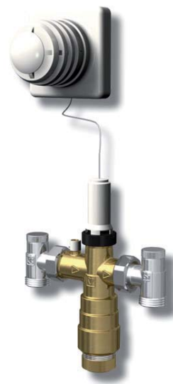
LK Minikretsventil M5.

Med minikretsventilen blir det enkelt att koppla in små golvvärmeytor till befintliga värmesystem. Du får även en snygg och diskret installation eftersom den lilla ventilen enkelt kan monteras infälld i vägg med inbyggnadsskåp eller utanpå vägg dold bakom en väggkåpa. Tänk på att den kan bara användas för system där man gjuter in golvvärmeröret i betong eller flytspackel.