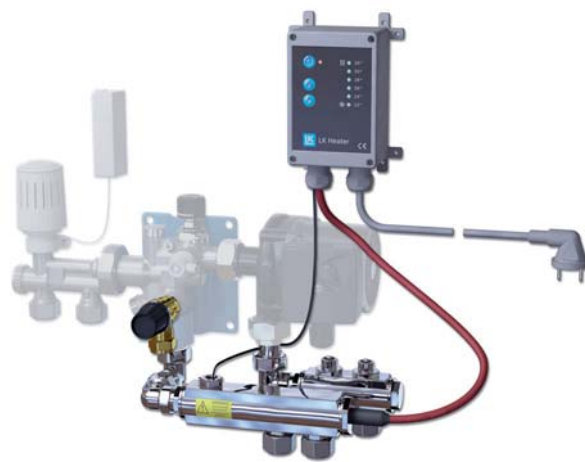
LK Heater 350 med LK Minishunt M60.

LK Heater 350 tillsammans med LK Minishunt M60 är en liten kompakt enhet avsedd för enstaka rum med golvvärme. Enheten ersätter rummets radiator (element).